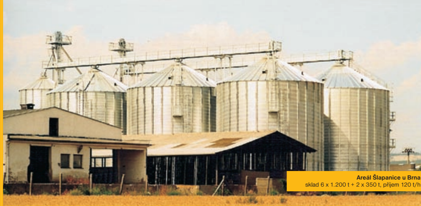
Areál Šlapanice u Brna sklad 6 x 1.200 t + 2 x 350 t, příjem 120 t/h