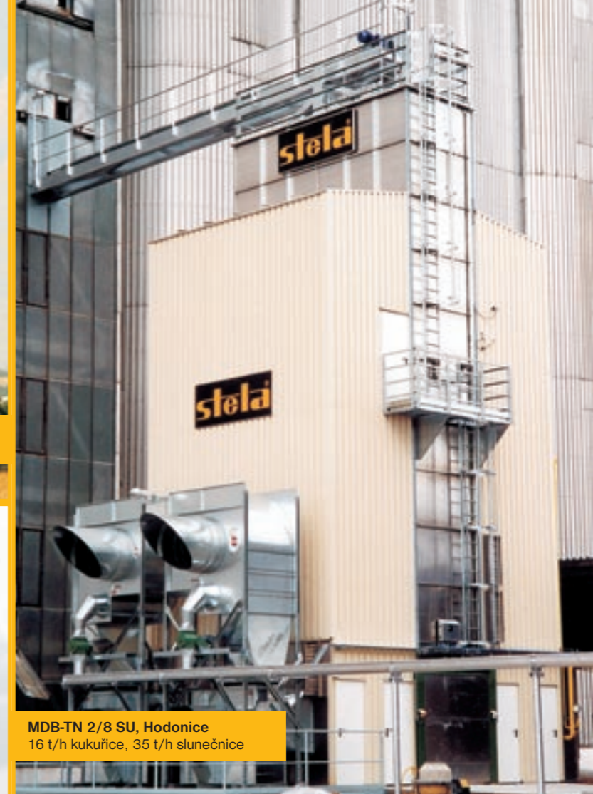
MDB-TN 2/8 SU, Hodonice 16 t/h kukuřice, 35 t/h slunečnice