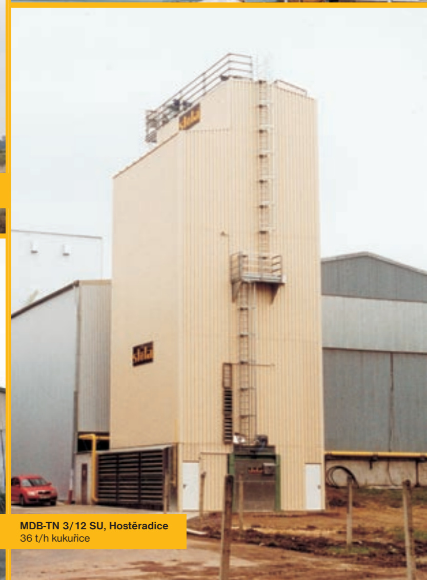
MDB-TN 3/12 SU, Hostěradice 36 t/h kukuřice