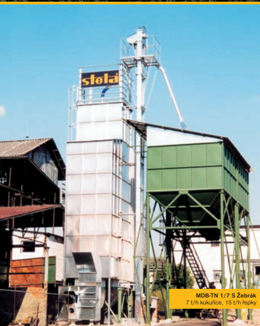
MDB-TN 1/7 S Žebrák 7 t/h kukuřice, 15 t/h řepky