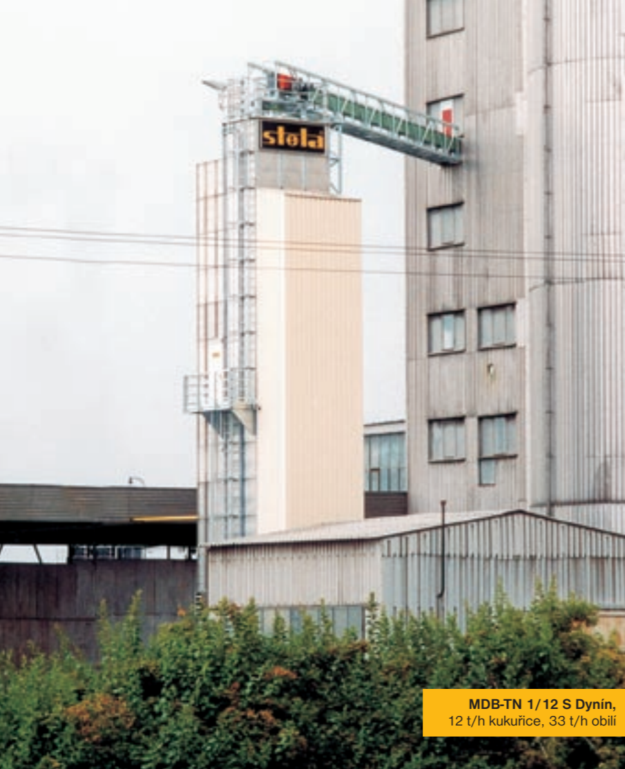
MDB-TN 1/12 S Dynín, 12 t/h kukuřice, 33 t/h obilí