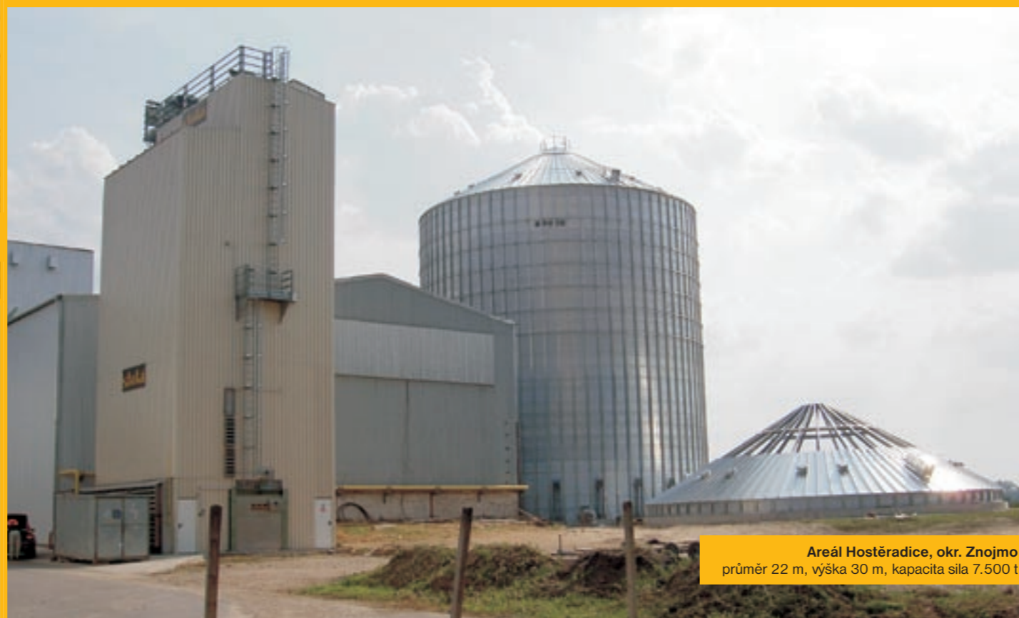
Areál Hostěradice, okr. Znojmo průměr 22 m, výška 30 m, kapacita sila 7.500 t